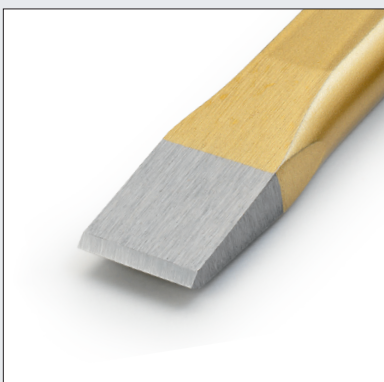
Hochwertige Werkzeuge - Poliertes Arbeitsende, geschliffene Schneide

Industrial quality tools Polished blade, ground edge