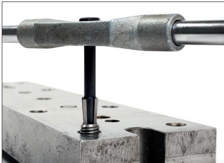
Spannen des Schraubenausdrehers mittels Windeisen Setting the extractor with a tap wrench