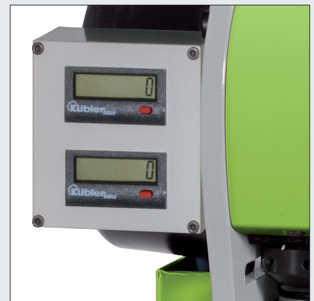
Zähler für Crimpverbindungen