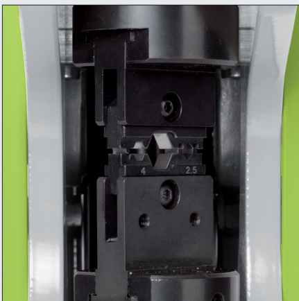
Drehbarkeit der Gesenke

Dies and locators can be used flexibly in hand crimping tool PEW 12, powered tool E-PEW 12 and crimping machine CM 25.