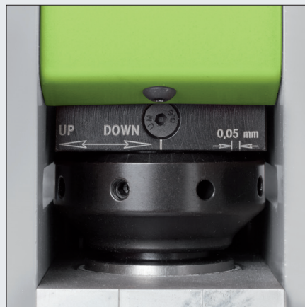
Feineinstellung des Crimpmaßes