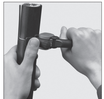
Umfangsschnitt Circular cut