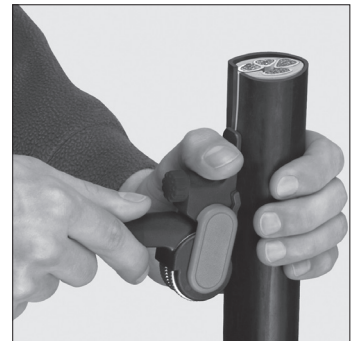
Längsschnitt Longitudinal cut