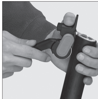
Ansetzen des Werkzeugs für Längsschnitt Setting the tool for longitudinal cut