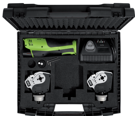
Bestückungsbeispiel Sample set

Please see our cable & connector tools catalogue for detailed information on locators or go to www.rennsteig.com